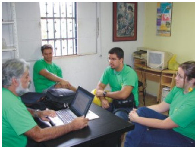
Foto de reunião do Clube da Flor - de - Lis.

O Clube da Flor-de-Lis tem por finalidade apoiar o Grupo Escoteiro Marechal Rondon – 4º DF, sendo órgão vinculado a diretoria do Grupo, bem como, oferecer oportunidades a pessoas que nunca participaram do Movimento Escoteiro, para que possam integrar-se ao movimento de forma ativa como membros da União de Escoteiros do Brasil e promover a reintegração de todos aqueles que já participaram do movimento escoteiro.