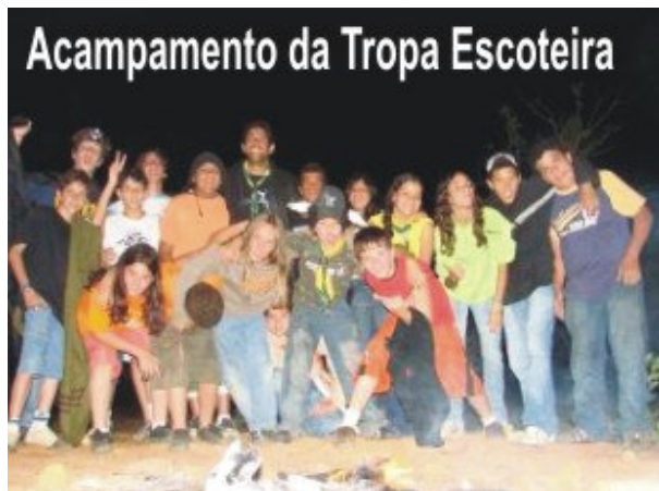
Acampamento da Tropa Escoteira

A seção Agenda apresenta datas e eventos importantes que acontecem no mês de dezembro de 2007! Ficou interessado? Programe-se e participe. Se você tiver sugestões de eventos para as próximas edições encaminhe à Equipe de O Cerrado .