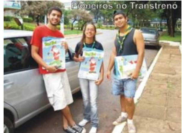
Pioneiros e seniores do Marechal Rondon estiveram na equipe de divulgação dos cartazes

O Clã Pioneiro e a Tropa Sênior do 4ºDF participaram da oitava edição do Transtrenó no mês de novembro. A campanha arrecada todo o tipo de doações para distribuir a quem precisa. A atividade é realizada pela Rádio Transamérica (100,1 FM) e tem, entre outros parceiros, os escoteiros do DF. Sempre Alerta para Servir o Melhor Possível os escoteiros ajudaram a divulgar o Transtrenó.